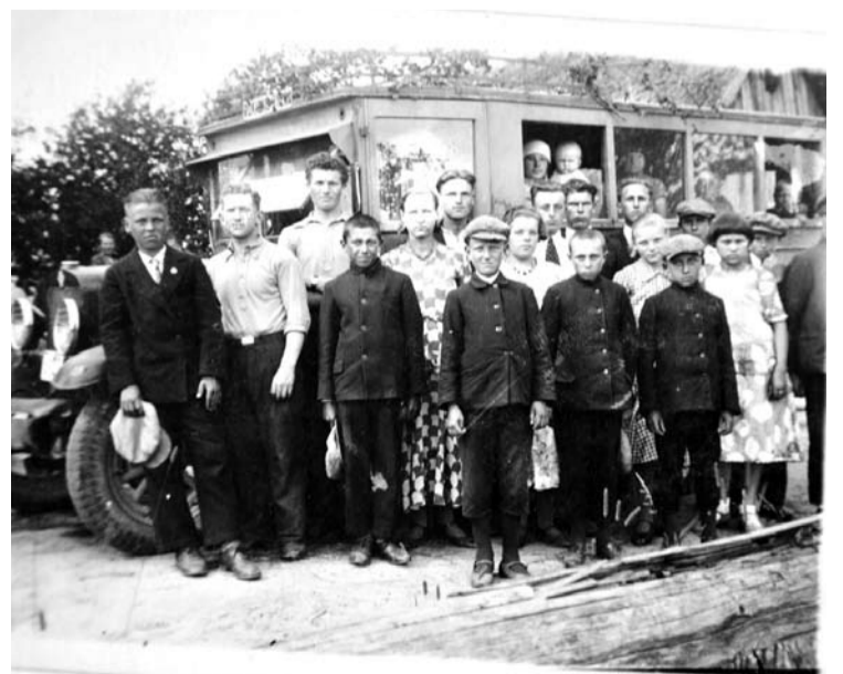
Kunigiškių pradžios mokyklos mokiniai vyksta į ekskursiją.