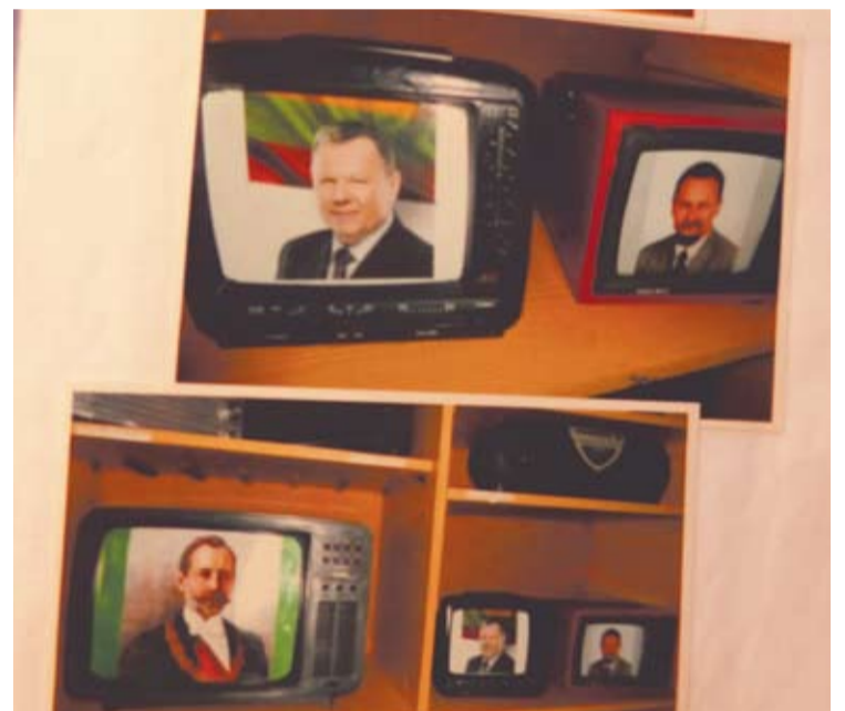
Debeikiuose įkurtame muziejuje vietos atsirado ir Anykščių rajono politikams.