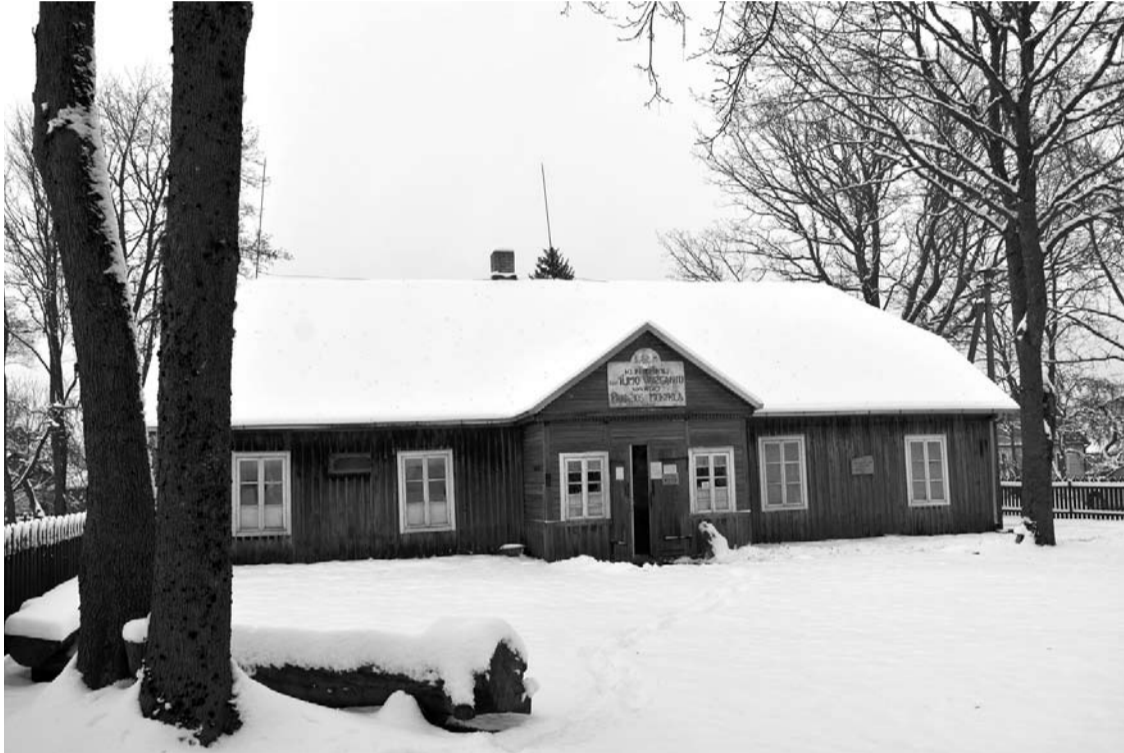
Svėdasų krašto muziejus įsteigtas restauravus buvusios Kunigiškių pradžios mokyklos pastatą.