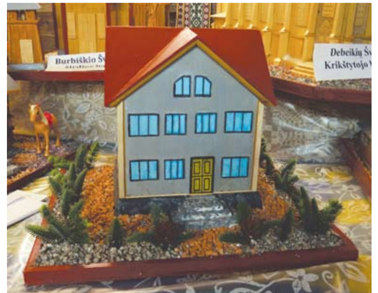
Broniaus Tvarkūno sūnėno namo prie Novosibirsko maketas. Maketą debeikietis sukūrė pagal nuotraukas.